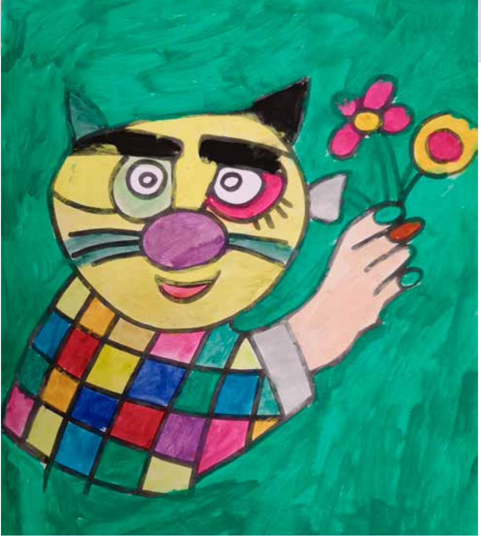
Belal Yasmineh, Klasse 4b Thema: Fantasiere nach Ottmar Alt