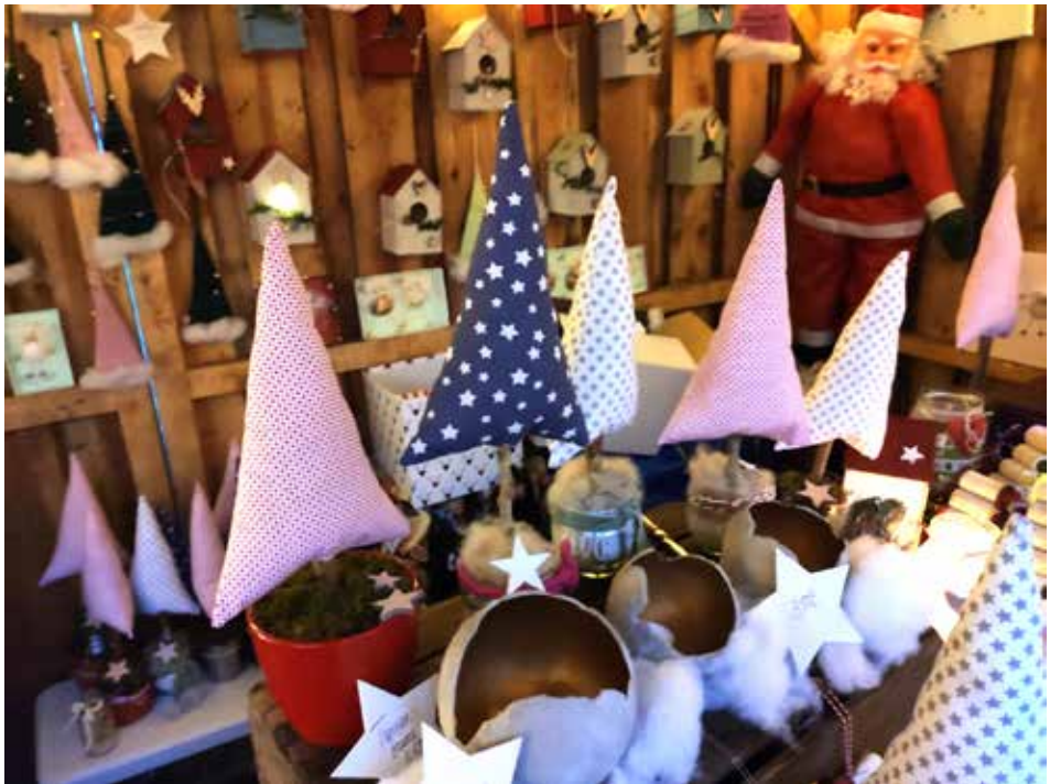
Weihnachtsmarkt Grundschule Maienbeeck 2019/20